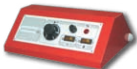
Пульт управления котла при работе с горелкой (опция)

Стальной водогрейный котел центрального отопления ЕКО-СКВ со встроенным бойлером из нержавеющей стали мощностью 30 – 50 кВт, работающий на твердом топливе (дрова, уголь). При снятии заглушки с нижней двери и установке пульта управления котел может работать с вентиляторной горелкой на солярке, газе или на пеллетах. Котел имеет лабиринтную конструкцию (топочная камера + 3 горизонтальных хода), позволяющую максимально использовать теплоту продуктов сгорания. При изготовлении котла применены качественные материалы и современные методы производства. Котел отвечает требованиям Европейских Норм EN 303-5.